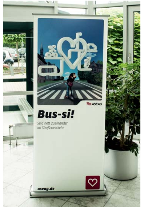
Roll-up-Banner im Foyer der ASEAG-Zentrale

Gemeinsam in den kommenden Wochen ein freundliches Klima schaffen: Um diese Botschaft in Aachen in der Region zu verbreiten, finden Sie unsere Motive und bis Ende August auf Plakaten, auf und in unseren Bussen, auf Postkarten und als Anzeigen.