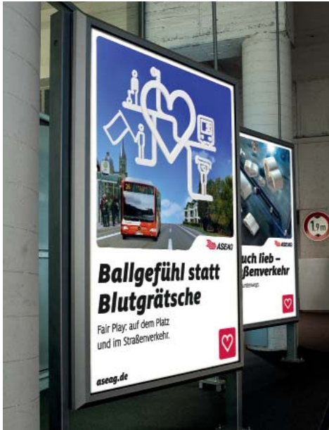
Motive im Parkhaus Elisengalerie

Es gibt jedoch immer wieder Situationen im Alltag, in denen unsere Kunden unzufrieden sind. In Ihnen wird das Unternehmen weniger „freundlich“, „sympathisch“ und „kundenorientiert“ wahrgenommen. Gerade im Straßenverkehr bestärken Baustellen, zunehmender Verkehr und das Gefühl, weniger Zeit zu haben, eine kritische Einstellung, die das Verhalten der Beteiligten beeinflusst.