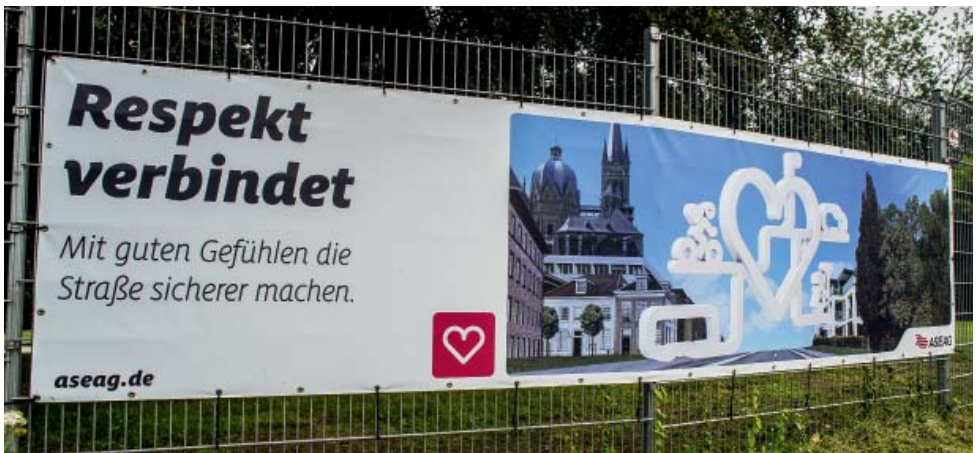
Banner am ASEAG-Gelände an der Neuköllner Straße

Die Kunden schätzen den kommunalen Hintergrund, und 90 Prozent verbinden die ASEAG mit der Region. Ein Großteil sieht die ASEAG als modernes, innovatives und umweltbewusstes Unternehmen.