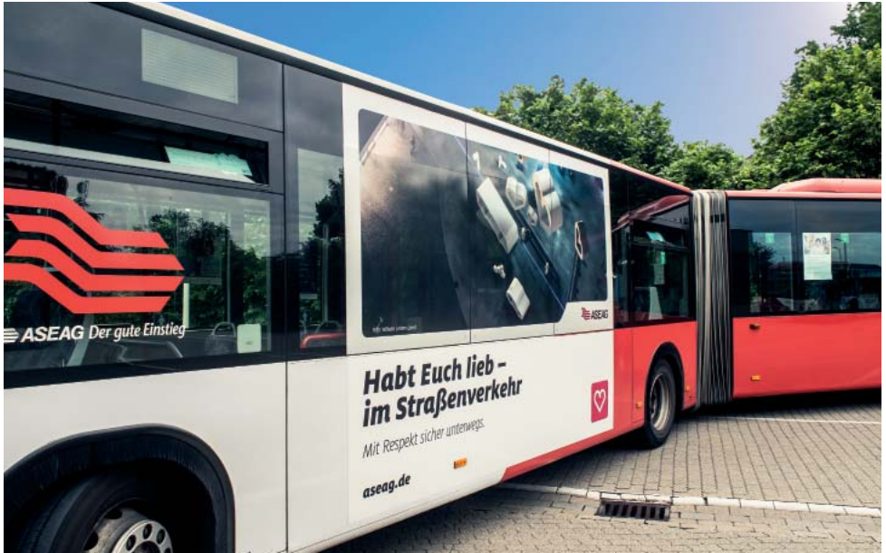
Kampagnenmotiv als Traffic-Board auf einem ASEAG-Bus